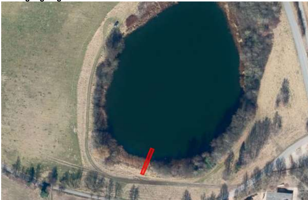
Placering af broen ved den sydlige søbred