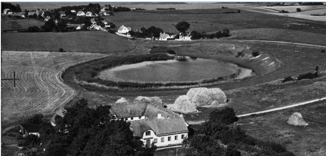
Figur 1 Lille Sø og omgivelser 1950

Halsnæs Kommune finder at etablering af mindre oplevelsesbro er i overensstemmelse med fredningens hovedformål den efterfølgende plejeplan og derfor ikke forudsætter dispensation fra Fredningsnævn.